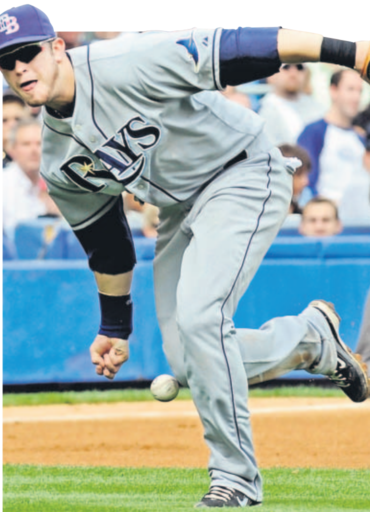
FIGURA. Evan Longoria, de Tampa Bay, fue el novato del año en la pasada campaña.

Las miradas están puestas en la división Este, donde hay rivalidad entre Yankees y Medias Rojas, además de lo que puedan hacer los Rays.