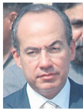
Calderón tratará con Obama el tema de la inmigración.

■ EU y México comparten una frontera de 3 mil kilómetros de extensión y son socios en el combate al narcotráfico.