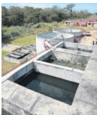
Planta de un promotor de Convivienda.

El Idaan exige a los promotores de vivienda construir plantas para el tratamiento de aguas, pero no tiene capacidad para mantenerlas.