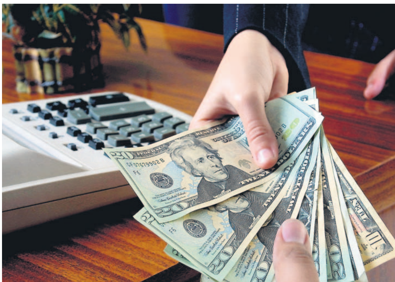
RECURSOS. A unos 300 millones de dólares asciende el acumulado del Feci, que ha aumentado en los últimos dos años.

Sin embargo, la cartera histórica que ha manejado el BDA con estos fondos ha oscilado entre $10 millones y $11 millones, y es por ello que diversos sectores abogan por