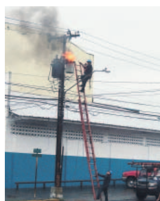
Operario de Unión Fenosa trata de sofocar incendio.