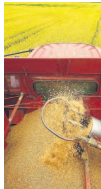
El agro requiere apoyo.

rio, pero no fue posible. El economista Rolando Gordón sugiere que se debe dar "una nueva orientación" a estos recursos, porque ahora solo están beneficiando a los grandes productores. "En este momento de crisis alimentaria, Panamá debe tener un sistema de crédito garantizado para que el pequeño y mediano productor tenga acceso al crédito.