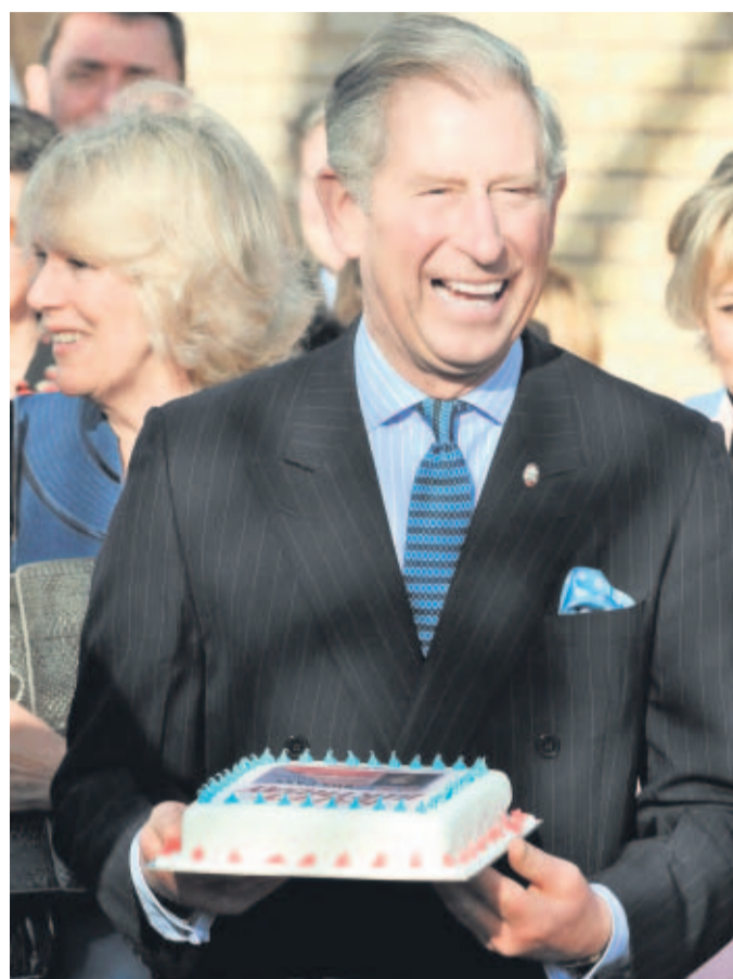
EL ETERNO PRÍNCIPE. Carlos recibió un pastel con una réplica de su pase de autobús.

Montealegre anunció la realización de dos "marchas pacíficas", una en Managua el martes y otra el domingo en León.