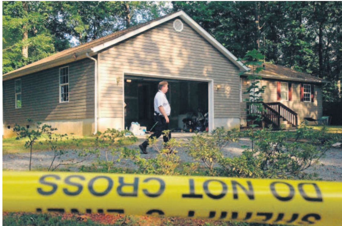
PALABRA. Un detective de homicidios del condado Montgomery participa en la revisión de la casa en donde se encontrarono los cuerpos de dos pequeñas asesinadas.