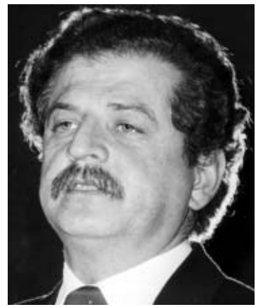
Luis Carlos Galán