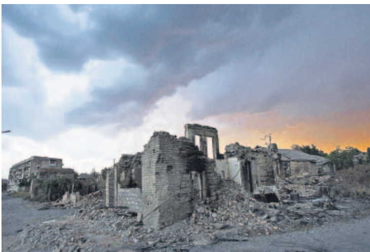
DESTRUCCIÓN. Vista de una calle de Tsjanvali tras el bombardeo georgiano a la capital de Osetia del Sur.

Mientras tanto, desde Tbilisi, la canciller alemana reiteró que retire sus tropas a Rusia de quien se exigiera la retirada de las zonas ocupadas en el territorio georgiano. "Esperamos señales y no en semanas, sino en días", apeló.