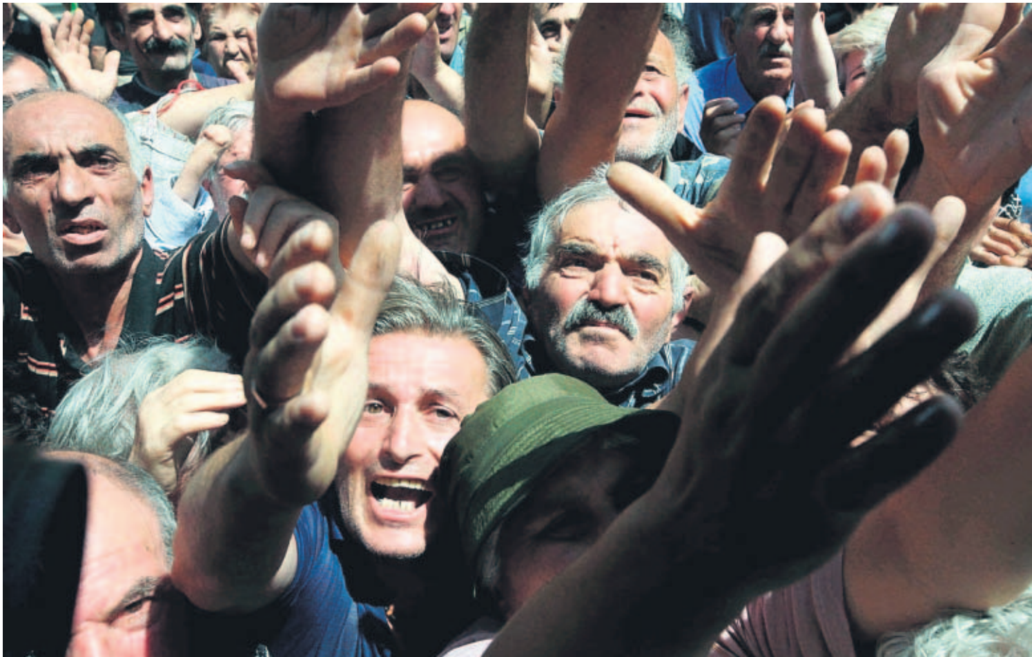
DAME PAN. Ciudadanos de Gori intentan acceder a un poco de la comida que llegó a la ciudad ayer, domingo.