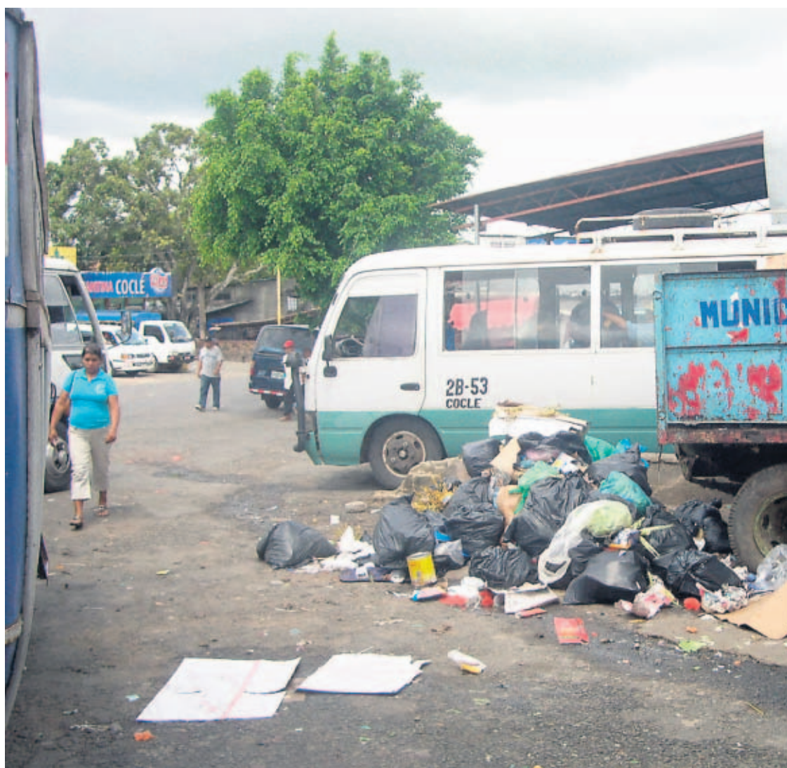
MOLESTIA. Los transeúntes deben soportar los olores fétidos provenientes de la basura.

La falta de higiene en la piquera que utilizan seis rutas de transporte rural del distrito de Penonomé mantiene incómodos a sus usuarios y a la población que transita, viaja y compra sus alimentos en el mercado público que está a un costado de la terminal. La situación se genera por la basura que se coloca en una carreta ubicada a un costado de las seis piqueras y detrás del mercado público. La carreta la colocó el Municipio de Penonomé hace más de 10 años. En el lugar hay aguas contaminadas, basura, olores fétidos y moscas que perjudican directamente a quienes deben caminar sobre los desechos.