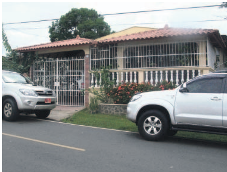
FUEGO. El atentado ocurrió aproximadamente a las 12:00 m.n.