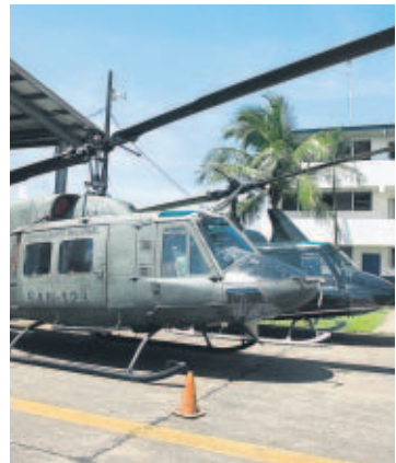
Cinco helicópteros serán arreglados.

Dijo que en el Ministerio de Economía se analiza una posibilidad de crédito adicional por