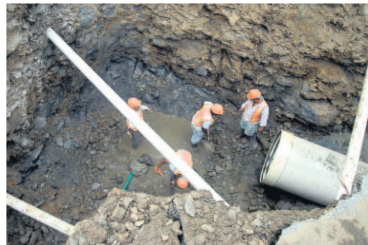
TRABAJOS. Colocación de tubería de la colectora Río Abajo y Monte Oscuro, en la Avenida Santa Elena.

Wilfredo Jordán Serrano wjordan@prensa.com