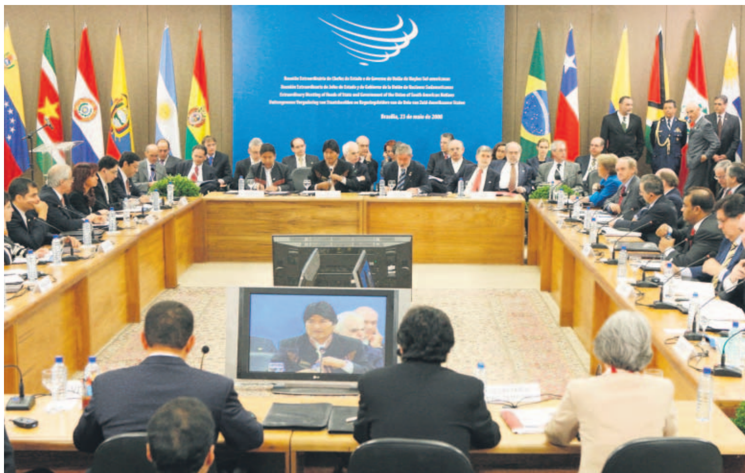
NACIMIENTO. Sesión inaugural de la cumbre en que se alumbró Unasur, celebrada el viernes 23 de mayo en Brasilia.

BLOQUE DE 12 PAÍSES. INTEGRACIÓN SUDAMERICANA.