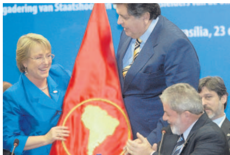
SÍMBOLO. El presidente de Perú, Alan García (c), entrega a su colega chilena Michelle Bachelet la bandera que representa la integración de los países de América del Sur.

"Queremos avanzar rápidamente con proyectos innovadores y de largo alcance en áreas prioritarias, como integración financiera y energética, mejoría de la infraestructura regional y de las conexiones