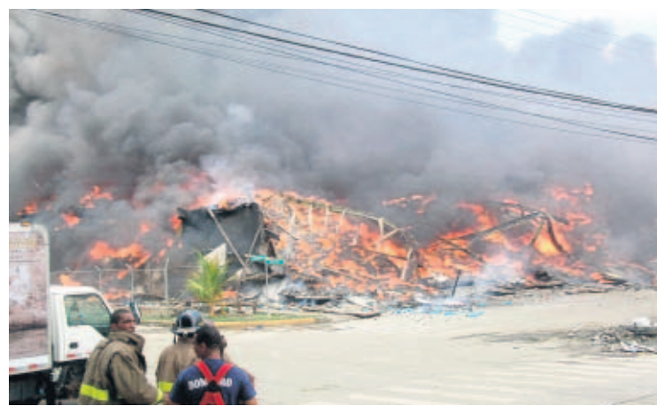
COLÓN. En el incendio registrado esta semana, en France Field, se quemaron siete bodegas y dos fueron afectadas.