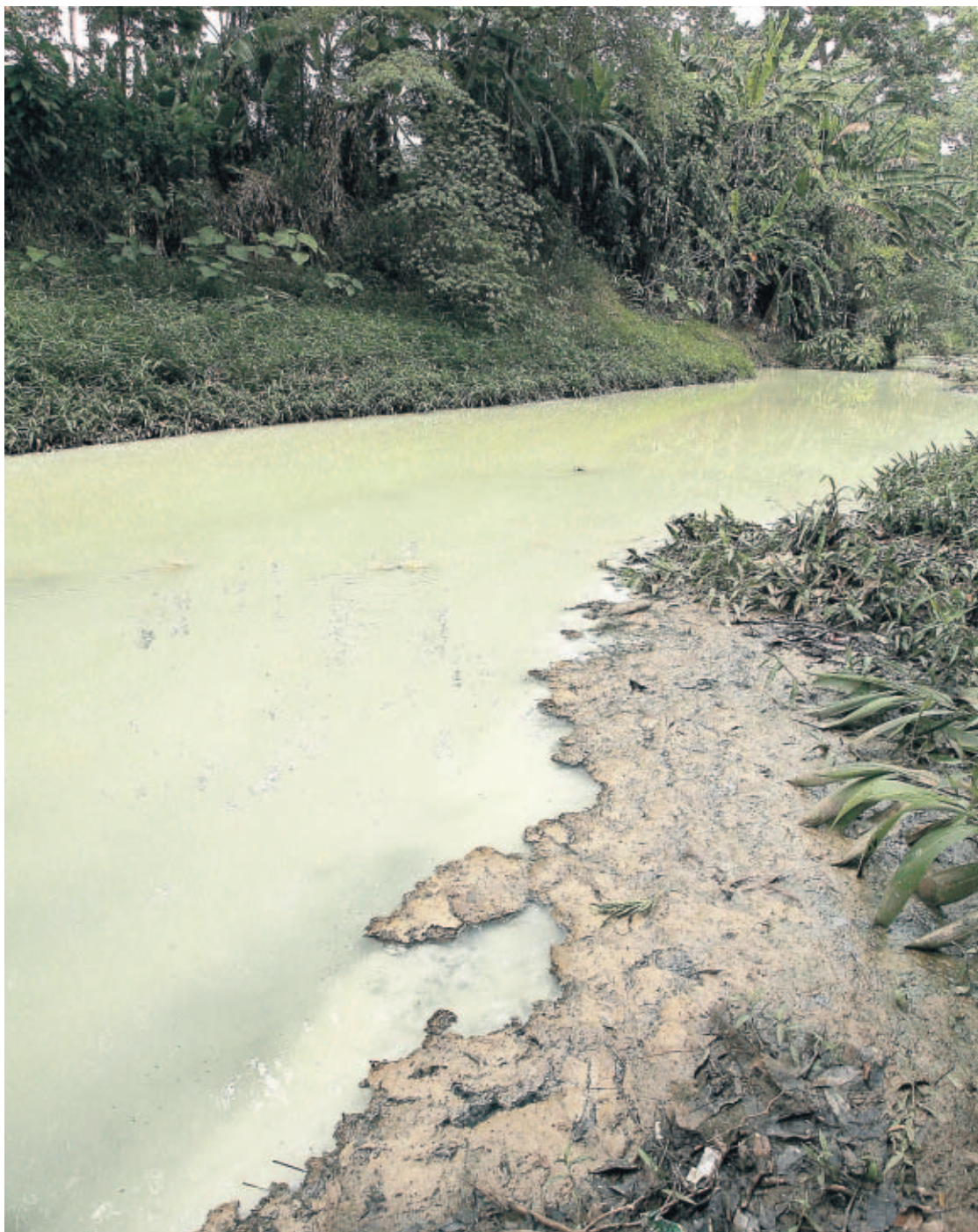
RIESGO. El río Tapia es uno de los seis principales afluentes que cruzan la ciudad de Panamá.

Análisis realizados por la Anam en 2005 y 2007 muestran un deterioro en la calidad del agua del río, de acuerdo con parámetros como oxígeno disuelto, coliformes fecales, sólidos totales y temperatura, entre otros.