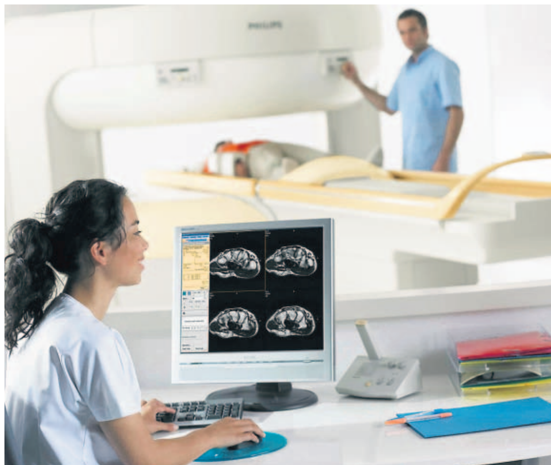
SERVICIO. Algunos hospitales panameños cuentan con tecnología médica de punta que los hace atractivos a extranjeros, en su búsqueda de tratamientos menos costosos.

Por ejemplo, en el principal mercado para Panamá, Esta-