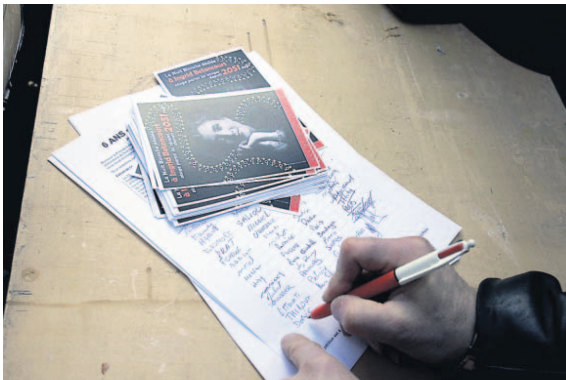
RESPALDO. Cientos de personas se han sumado a las peticiones por la liberación de la ex candidata presidencial Ingrid Betancourt y los casi 700 rehenes aún retenidos por las FARC.

■ El gobernador de Putumayo denunció que los rehenes han estado en campamentos de las FARC en Ecuador.