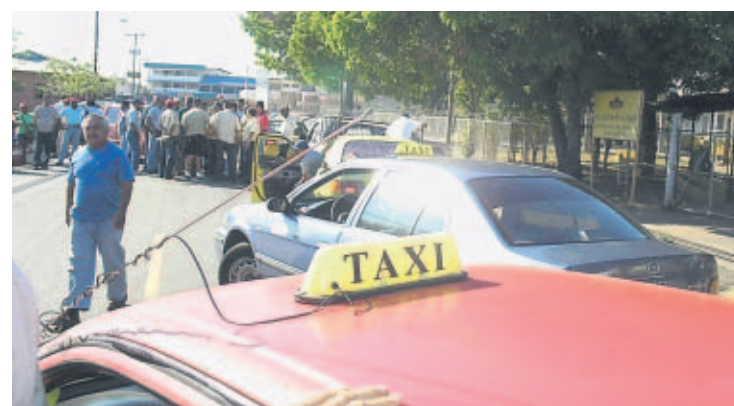
QUEJA. Las calles están llenas de huecos, que en invierno se vuelven intransitables.

La medida de presión, que empezó a las 7:00 a.m., hizo que 40 conductores a estacionaran sus vehículos en la Avenida Rafael Estévez, obstruyendo el tránsito e impidiendo que cualquier carro del ministerio saliera o entrara del lugar.