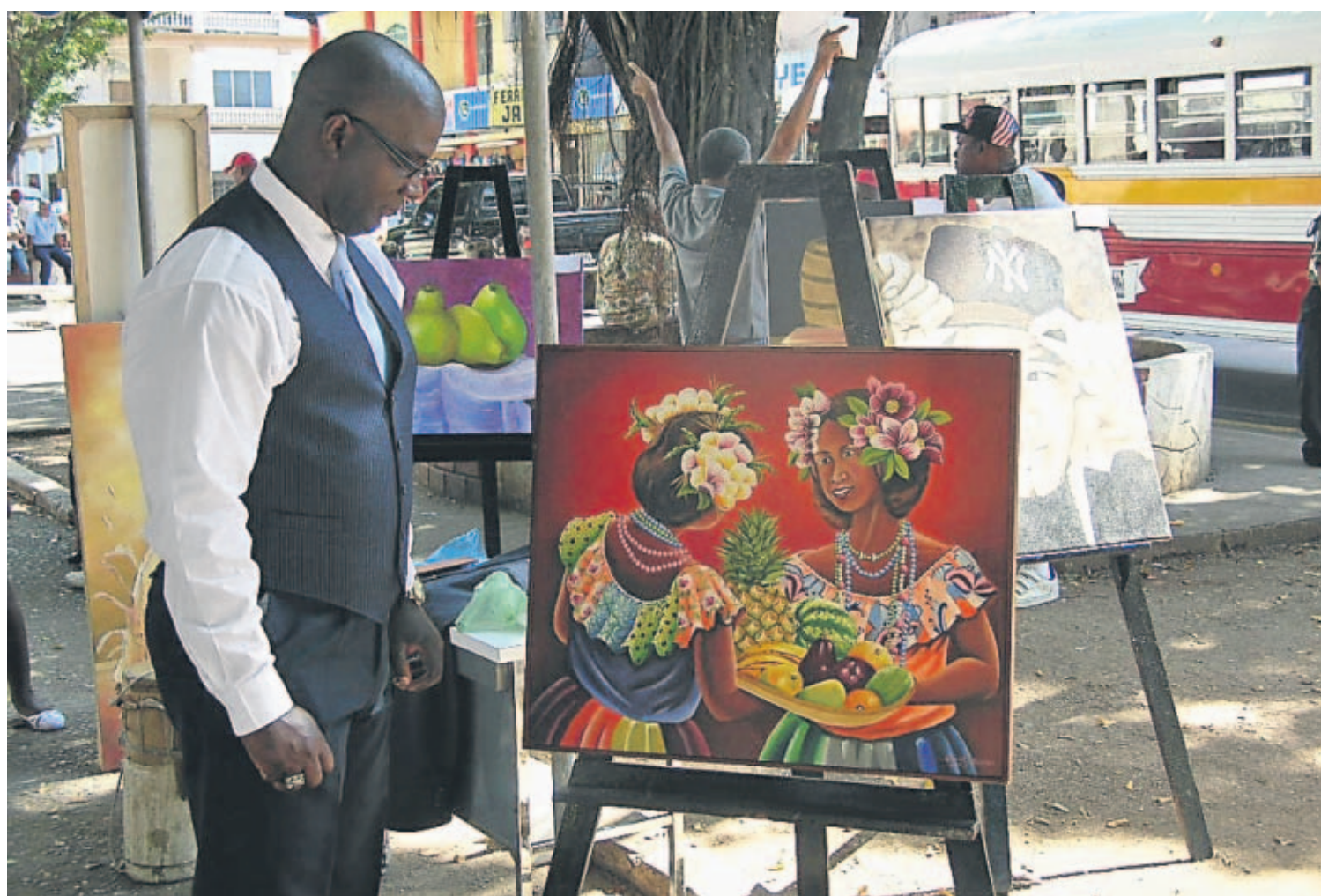
ANIVERSARIO. El parque Juan Demóstenes Arosemena fue escenario de una galería de fotos y pinturas.