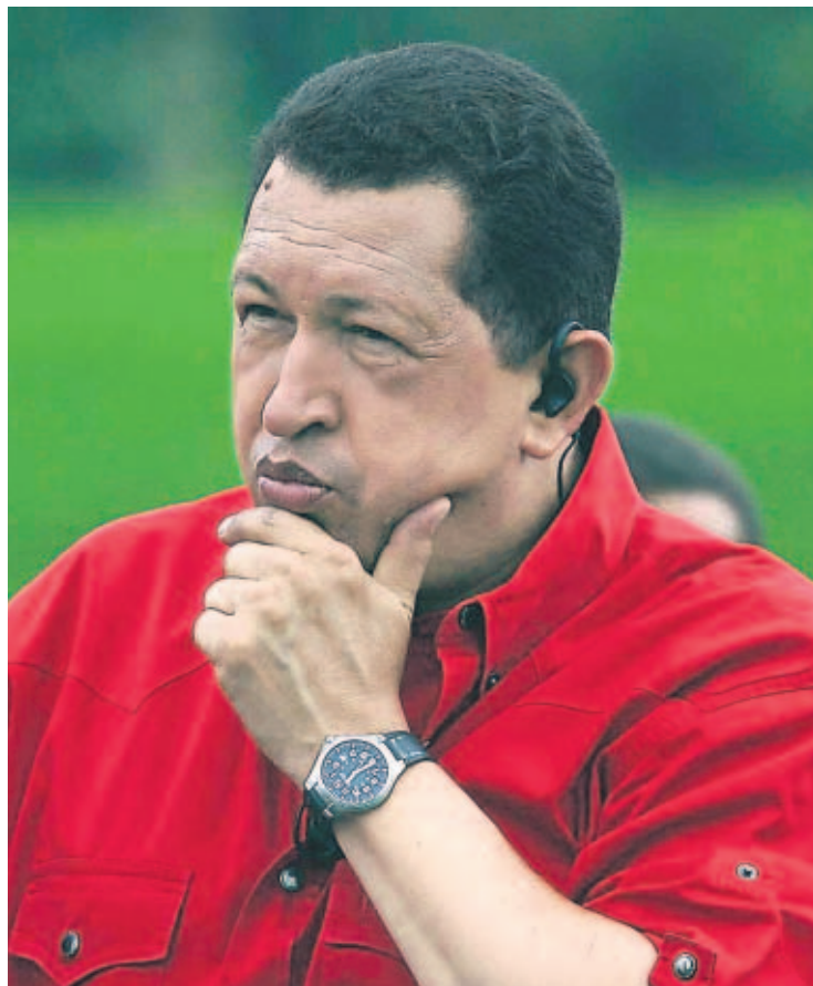
RESPUESTA. Mandatario dice que Estados Unidos es hipócrita y recuerda el caso de Posada Carriles.

Chávez comentó así un proyecto de resolución de legisla-