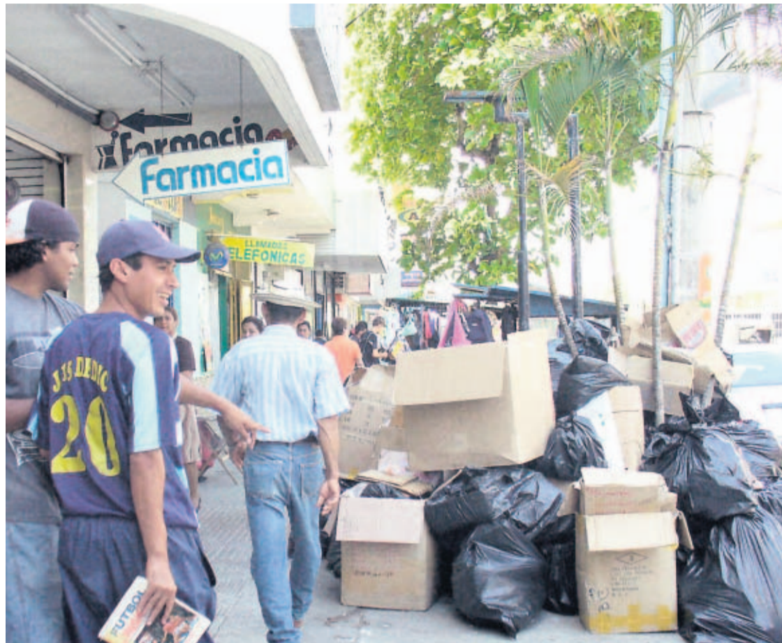
SALUD. La comunidad penomeña teme que se desate una epidemia.

Agregó que están conscientes de que el cierre del vertedero mantiene acumulada una gran cantidad de basura por toda la ciudad; sin embargo,