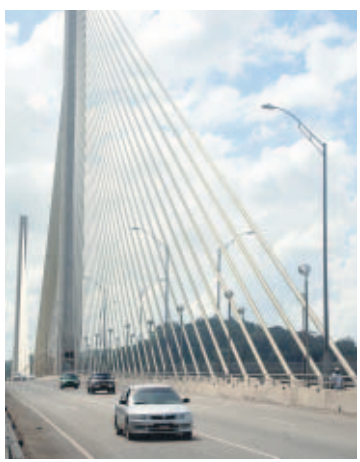
Refuerzan vigilancia.

La obra, construida durante el gobierno de la presidenta Mireya Moscoso a un costo de 104 millones 337 mil dólares, está ahora en penumbras.