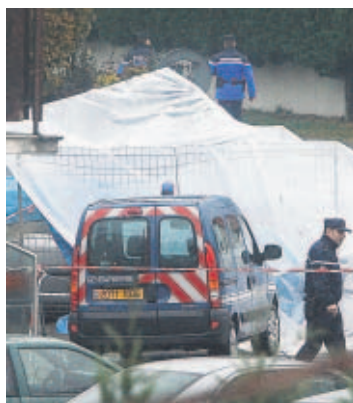
Escena del crimen.

Los dos agentes, desarmados y que participaban con colegas galos en una misión de vigilancia de etarras, fueron tirotea-