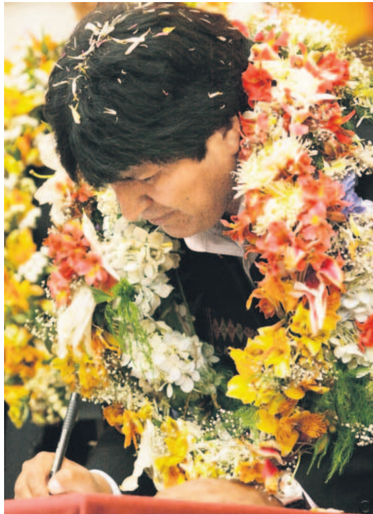
FIRMA. Evo Morales en el momento de rubricar la Renta Dignidad para los ancianos.

■ La nueva carta magna contempla reelección presidencial indefinida o mayor control de los medios.