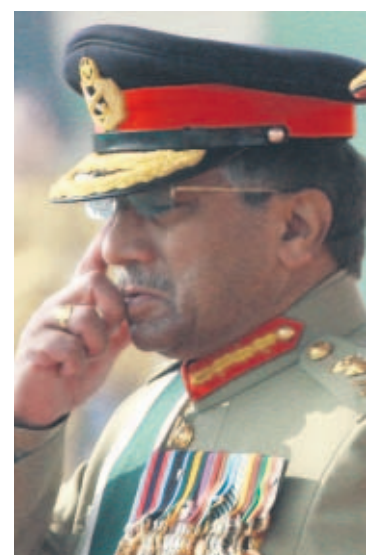
Musharraf intenta no llorar.

Durante el cambio de mando en la guarnición de Rawalpindi en las inmediaciones de la capital Islamabad, Musharraf _que tiene el rango de general_ cedió el puesto al entregar el bastón protocolario a su sucesor, general Ashfaq Kayani, quien según la noción generalizada mantendrá la posición favorable a Occidente que ha