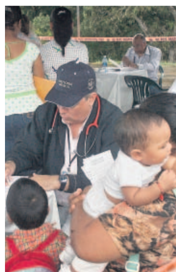
Hoy se hará otra feria de salud en San Miguelito.