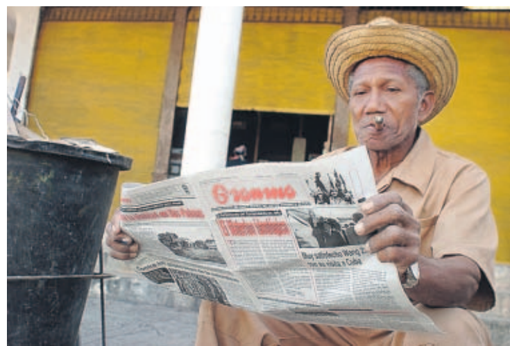
CRÍTICAS. Cubano lee el artículo de Fidel Castro en el periódico 'Granma'.

Por tercera vez consecutiva Castro sale en defensa de Chávez después del altercado que este tuvo con el rey Juan Carlos