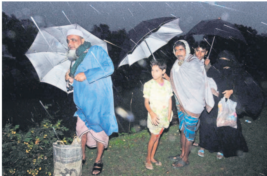
LLUVIAS. Familia en vías de evacuación antes de la llegada del ciclón Sidr, que ha azotado Bangladesh con vientos de 240 kilómetros por hora.

La mayor parte del país permanece a oscuras por la destrucción de las líneas eléctricas.