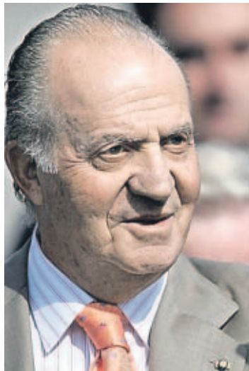
Rey Juan Carlos II

■ El monarca intervino cuando ambos países se encontraban en un punto muerto en el diálogo.