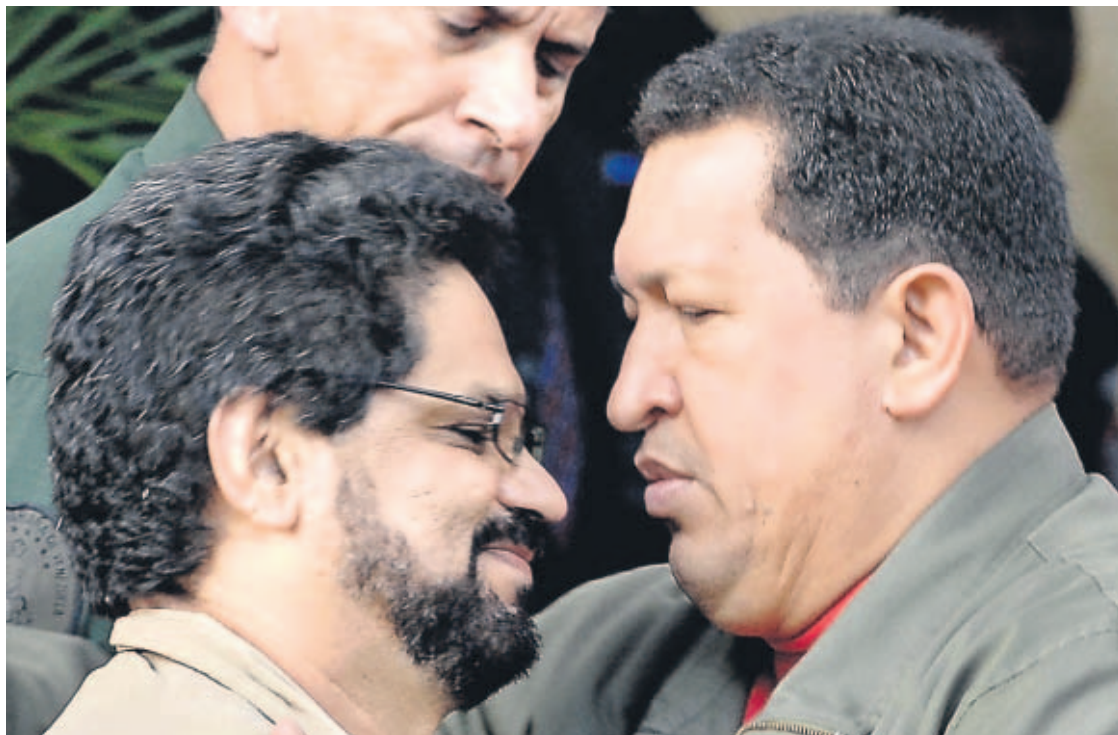
ENCUENTRO. Chávez (Der.) apareció junto a Iván Márquez, miembro del Secretariado de las FARC, en Caracas, para reportar la marcha de las negociaciones para liberar a secuestrados.

■ Presidente venezolano reitera esperanza de reunirse con el comandante de las FARC, Manuel Marulanda.