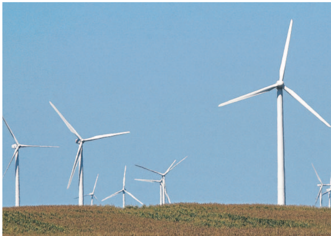
APOYO. 30% de los fondos obtenidos a través de bonos de carbono serían invertidos en la comunidad de Santa Fe de Veraguas.

“En estos momentos estamos negociando con los fabricantes de los generadores para saber cuál es la mejor alternativa”, agregó el inversionista panameño.