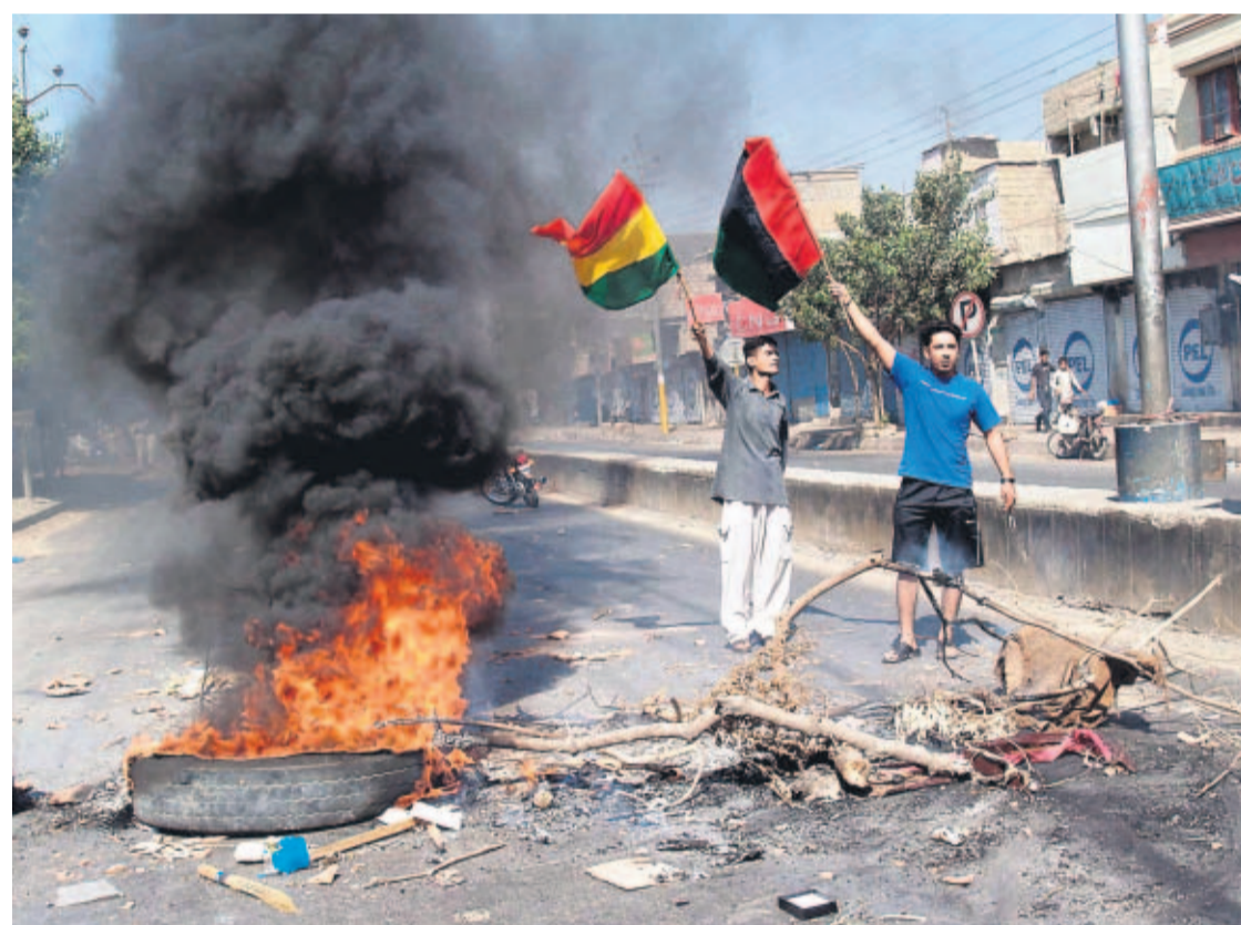
REACCIÓN. En algunos barrios de la ciudad de Karachi se realizaron ayer quemas de neumáticos y lanzamiento de piedras para repudiar el atentado que produjo 139 muertos, el jueves pasado.

Con anterioridad, el gobierno rechazó las acusaciones de Benazir Bhutto de que algunos