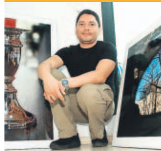
IMAGEN Y EXPRESIÓN A TRAVÉS DELLENTE

Una muestra colectiva donde 11 fotógrafos con distintas técnicas exhiben su trabajo. 4B