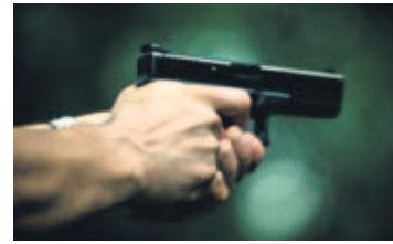
Mantener el equilibrio es primordial en esta actividad.