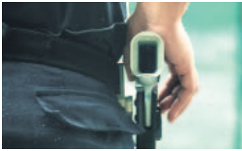
El arma debe estar descargada si no se está en la línea de tiro.

REGLAMENTACIÓN - Todo club o galería de tiro establece reglas estrictas de seguridad entre los miembros.