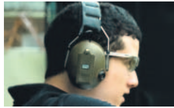
La práctica se debe hacer con protección auditiva y visual.