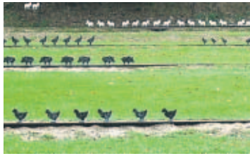
Tipos de silueta que se usan para hacer tiros a distancia.