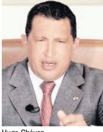
Hugo Chávez

La muerte de ambas mujeres ocurre luego de que las empresas de seguridad fueron sometidas a intenso examen, a raíz de la muerte de 17 civiles iraquíes en Bagdad durante un tiroteo ocurrido el 16 de septiembre.