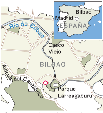
Ocurrió en el barrio de clase obrera de La Peña a las 11:35 a.m. Un guardaespaldas de un político local del Partido Socialista Obrero Español resultó herido.