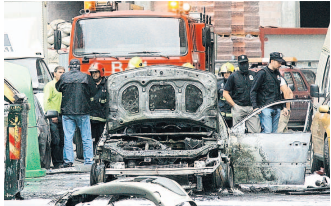
ESCENA. La bomba fue colocada debajo del auto de un hombre de 36 años que protegía a un político del partido del presidente de gobierno, José Luis Rodríguez Zapatero.

Todo indica que él era el objetivo de los terroristas, pues si bien custodia a Juan Carlos