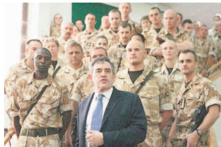
AL MANDO. Brown arribó a Basora, donde conversó con las tropas británicas. El anuncio de la retirada alegró a muchos.

Esta nueva medida ha sido anunciada un mes después de que las tropas británicas evacuaran los palacios presidenciales de la ciudad de Basora, que utilizaban como cuartel general, y se retiraran a una