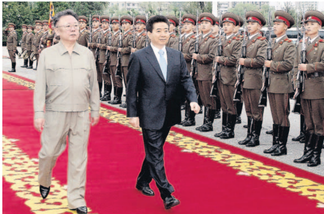
SOLEMNIDAD. El presidente de Corea del Sur Roh Moo Hyun (derecha), es recibido por el líder norcoreano Kim Jong Il. Hasta hoy, las dos naciones permanecen técnicamente en guerra.

La península coreana quedó dividida en dos países poco después de finalizar la Segunda Guerra Mundial.