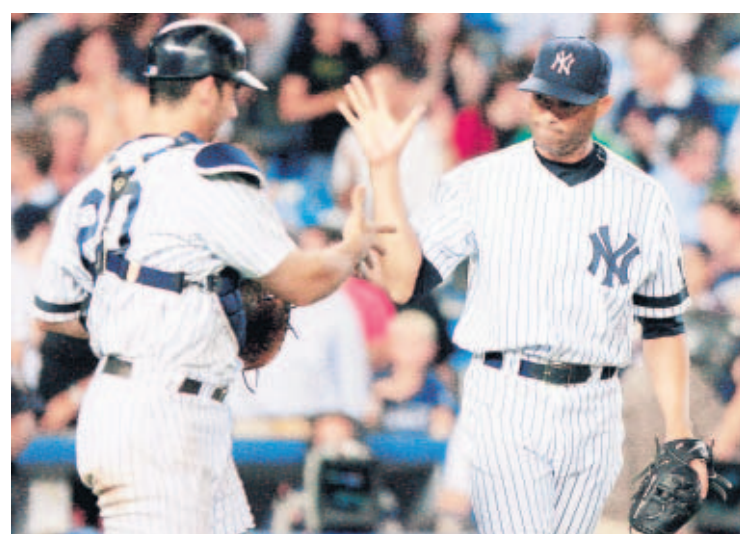
VALIOSO. El relevista panameño Mariano Rivera se constituye en un arma clave para los Yankees.