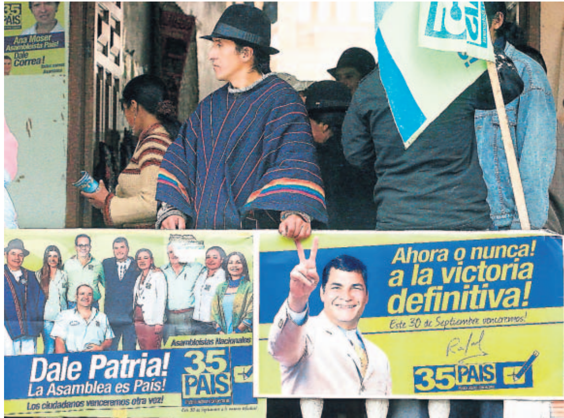
TRANSPARENCIA. A los observadores les preocupa la capacitación de los miembros de las juntas de recepción de votos; aunque no ven la posibilidad, de momento, de un posible fraude.

Más de 3 mil 200 candidatos se han inscrito para disputar los 130 escaños de la Asamblea, en unos comicios que se-