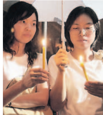
Ciudadanos, residentes en Tailandia, oran por la paz.

Mientras tanto, Gambari volvió directamente desde la metrópolis portuaria de Rangún a Naypyidaw, 300 kilómetros más al norte, donde hace dos años la Junta Militar trasladó la sede del gobierno.