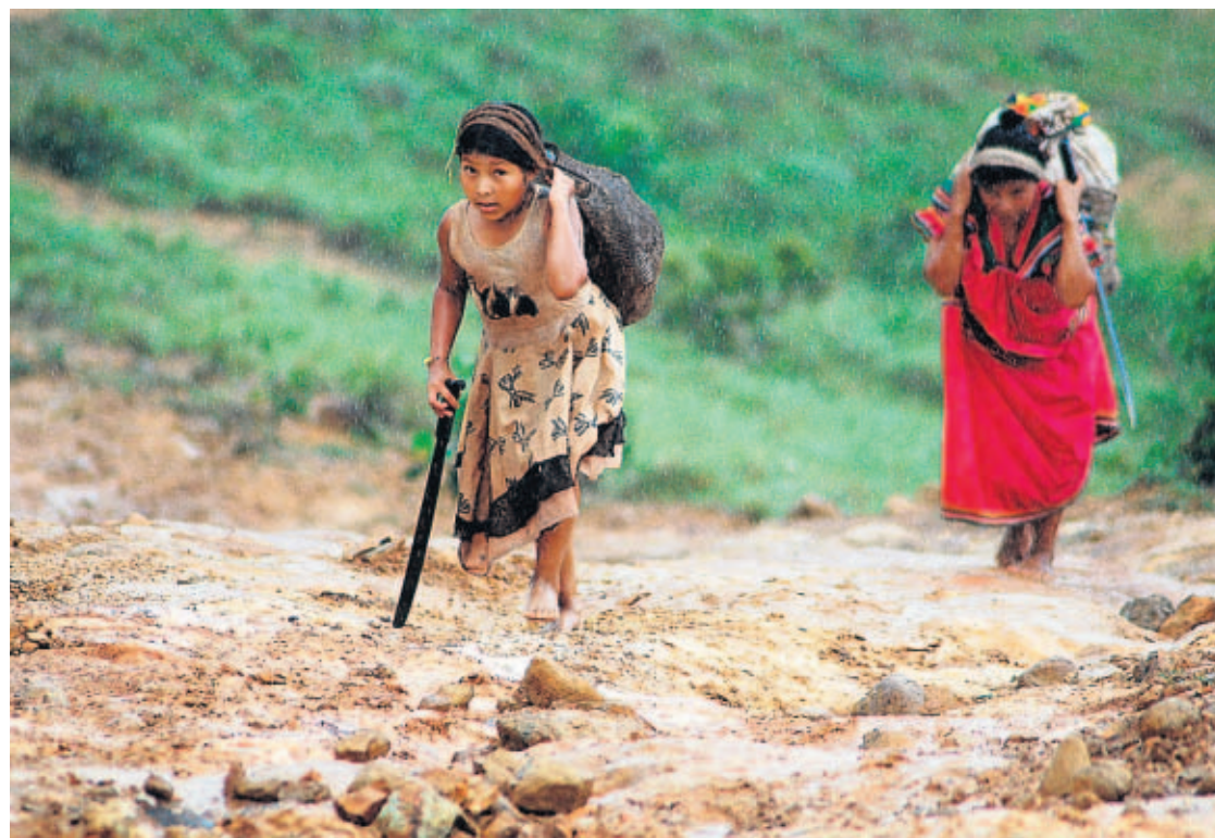
AGUA DE SALUD. Todos los casos denunciados hasta ahora por las comunidades indígenas están en el corregimiento de Agua de Salud, en el distrito de Ñurúm.

■ Dos infantes que también sufrieron fallas respiratorias fallecieron. Tres más están enfermos, uno está grave.