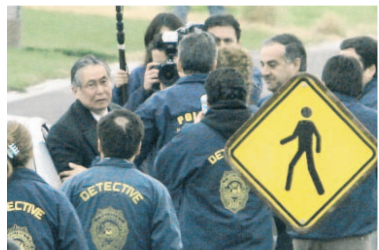
ENTREGA. Fuertes medidas de seguridad, entre ellas el cambio de lugar de llegada, fueron implementadas por las autoridades.