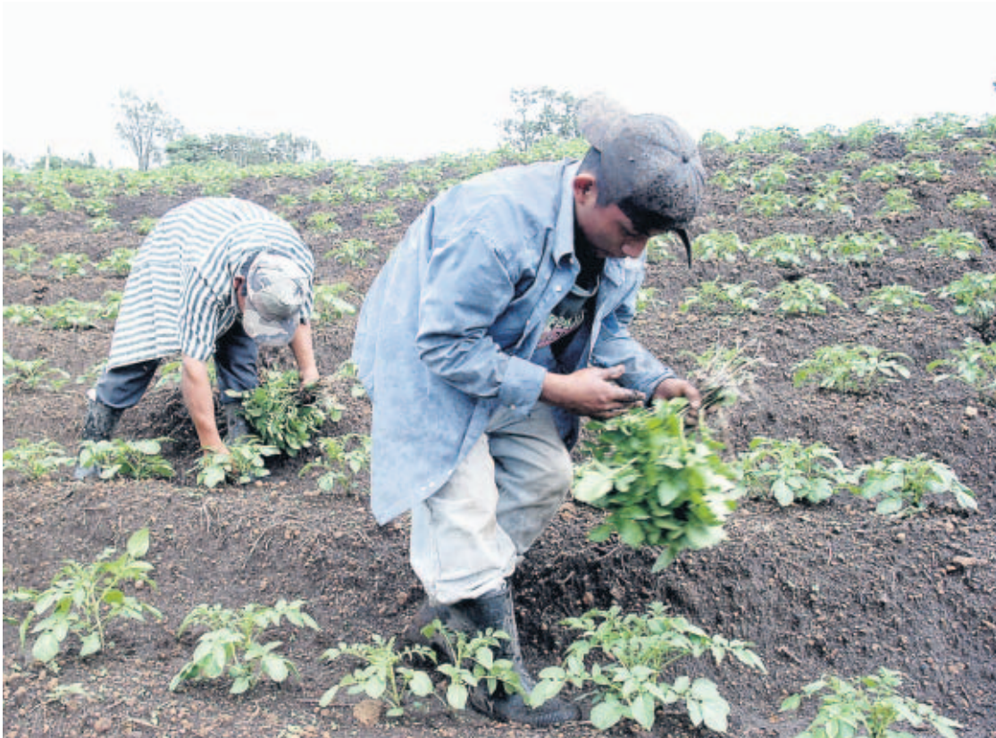
PÉRDIDA. El informe de la secretaria de la OMC afirma que el gobierno mantiene un gran número de subsidios que no ha tenido efecto positivo en sectores como el agrícola.

"El número y complejidad de los programas de incentivos de vigor suscitan preguntas sobre su eficacia como instrumento de desarrollo, especialmente en el contexto del recurrente déficit fiscal del sector público de Panamá", resalta el organismo que agrupa 151 países.