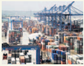
PASE A LA 44A