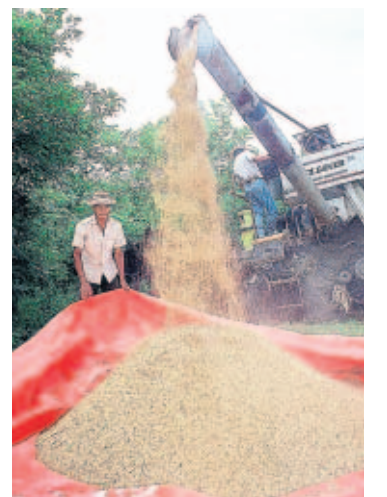
En julio se inició la cosecha.