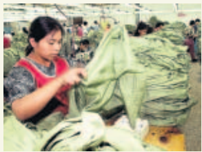
PASE A LA 47A