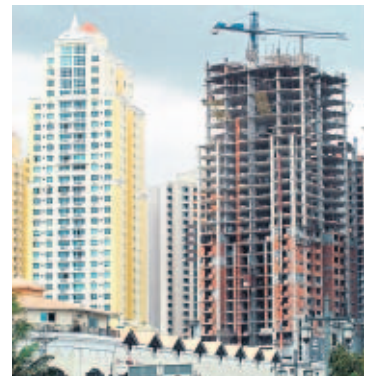
Bancos internacionales prestarán menos a extranjeros.