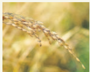
PASE A LA 41A