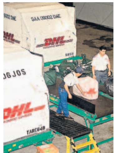
DHL es una de las aerolíneas de carga en Panamá.

Esto se reflejó también en el volumen de la carga. Según el informe de Tocumen, se mo-