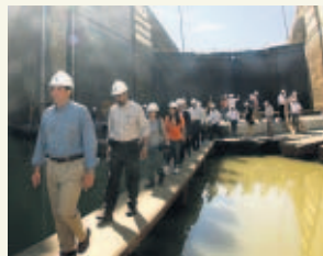
PASE A LA 40A