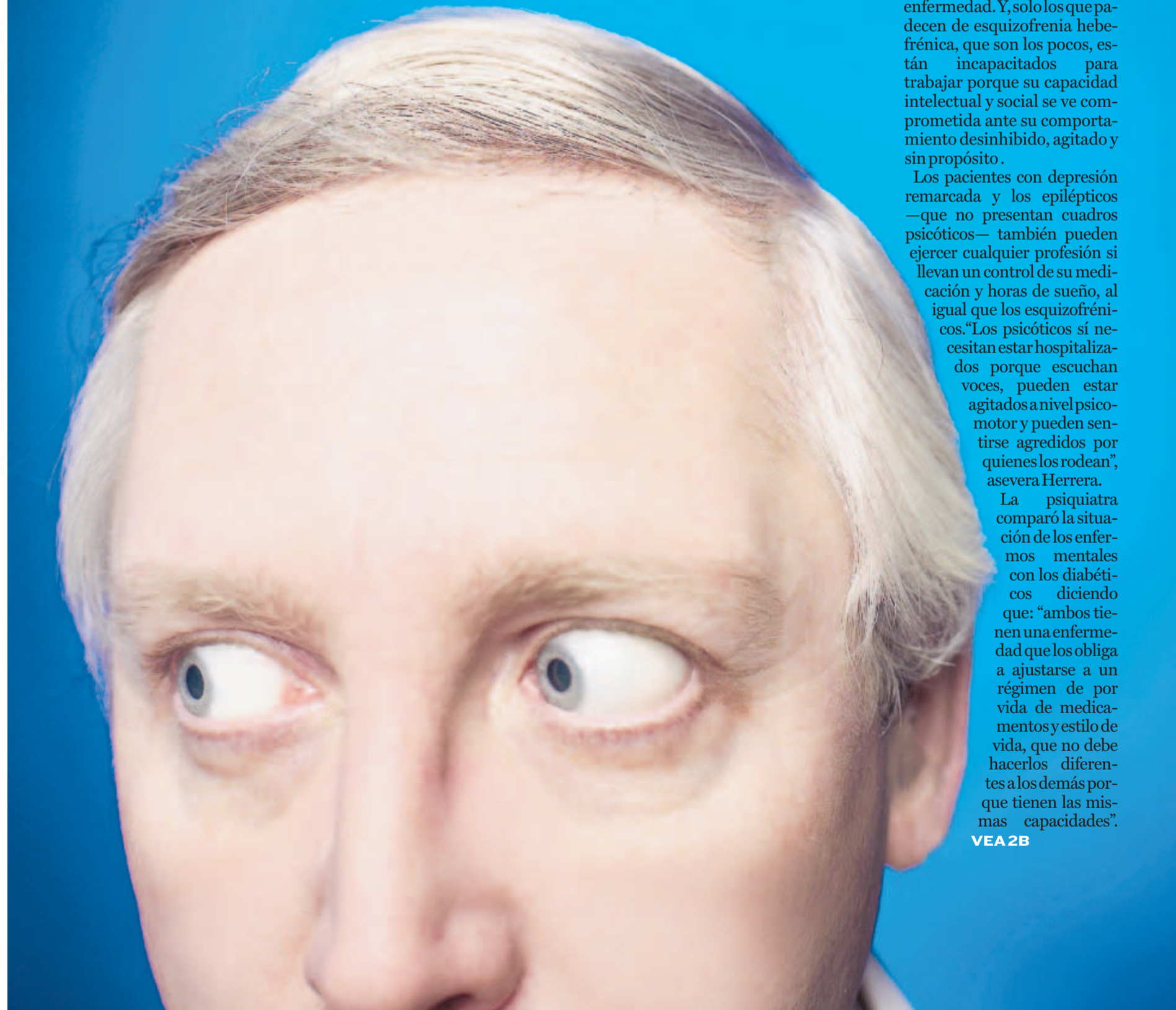
Index Stock Imagery, Inc.