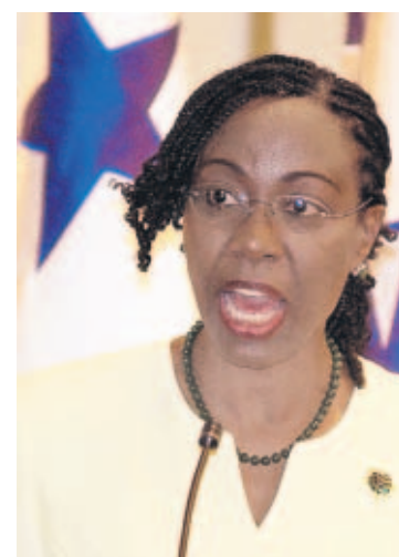
Graciela Dixon

Dixon, cuyo período de 10 años en la Corte culmina en diciembre próximo, fue candidateada a través de la misión permanente de Panamá ante las Naciones Unidas. La elección está prevista a celebrarse entre el 30 de noviembre y el 14 de diciembre venidero cuando se reúnan en una Asamblea los países miembros del Estatuto.