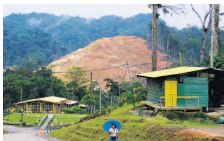
DEVASTACIÓN. Miembros de ANCON visitaron el proyecto el pasado 24 de agosto.