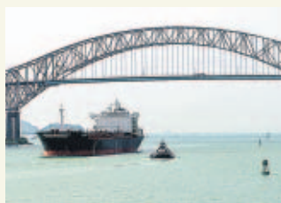
PASE A LA 44A