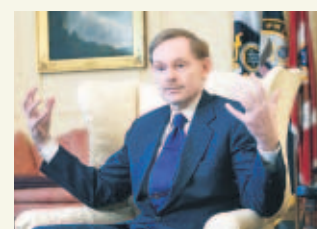
PASE A LA 50A