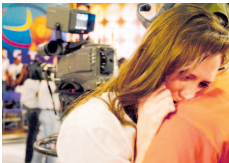
TRISTEZA. La actriz Cynthia Lander llora durante los últimos minutos de transmisión de 'RCTV'.