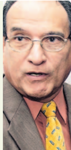
Reynaldo Rivera, Ministro de Trabajo y Desarrollo Laboral

“La construcción es la actividad laboral del país que ha registrado mayor crecimiento, a tal punto que en los últimos tres años prácticamente se ha duplicado el número de trabajadores. Antes oscilaba entre 30 mil y 35 mil personas, y ahora hay 55 mil y 60 mil. Pero también es la actividad más riesgosa”.