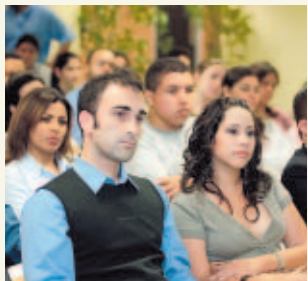
PASE A LA 47A