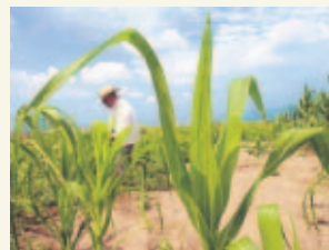
PASE A LA 46A