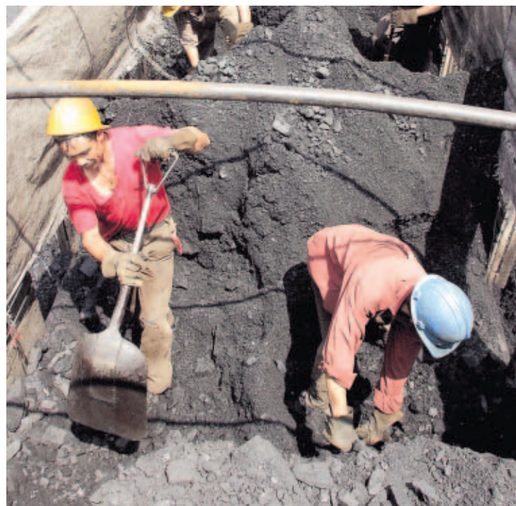
COMBUSTIBLE. Trabajadores remueven carbón en Belencito, Colombia, país de donde se traerá la materia prima necesaria.

La Anam identificó 22 impactos potenciales, de los cuales siete pudieran incidir sobre el medio físico (aire, agua, suelo, paisaje); seis impactos biológicos (flora y fauna) y nueve socioeconómicos. En este último aspecto, la Autoridad destacó la generación de empleos temporales e indirectos, la reducción de precios por generación de energía eléctrica y la generación de desechos.