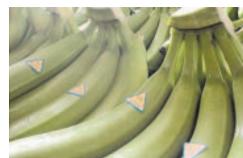
La fruta sigue siendo el principal producto de exportación. LA PRENSA