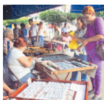
Aumentarán el tiraje de los chances y billetes.

La oferta en el sorteo del Gordo del Zodiaco no es suficien-