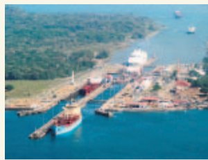
PASE A LA 40A