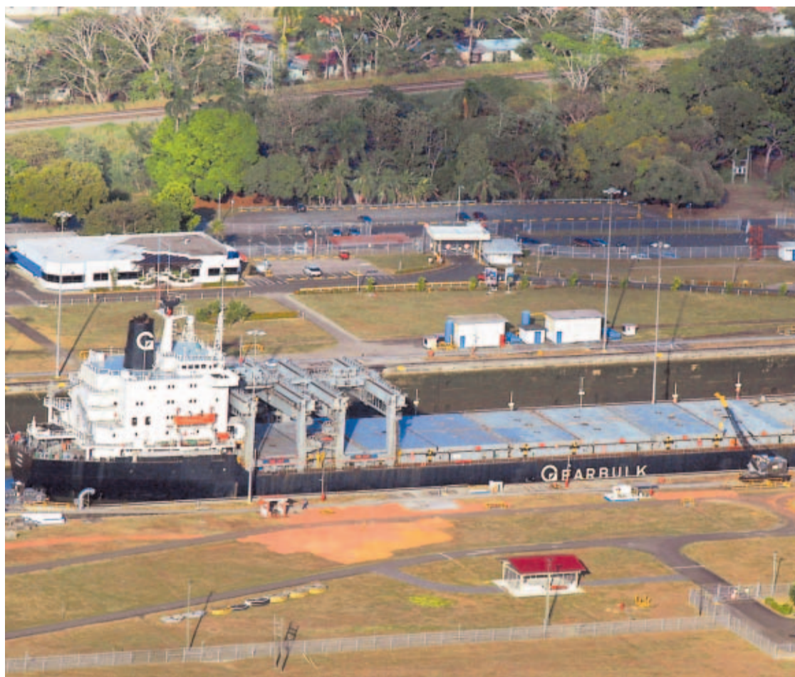
EN LA ESCLUSA. Además de Pemex, otras 26 empresas tienen licencia para importar y distribuir combustible.