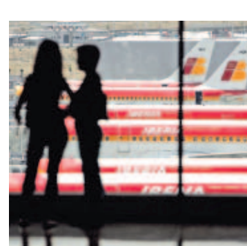
Buscan aumentar el número de cupos aéreos.