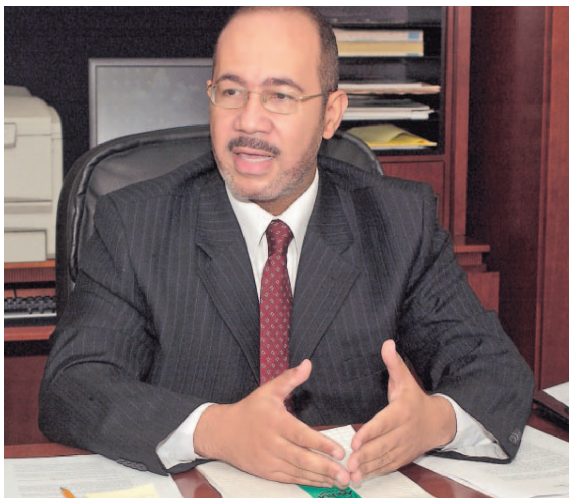
POSTURAS. Leroy Sheffer, jefe negociador, le dará seguimiento a la reunión del G-33 desde Panamá.

Sheffer aseguró que en el caso de Panamá sus posturas siguen siendo enmarcadas en conseguir la salvaguarda agrícola especial para productos sensibles, una desgravación arancelaria diferenciada, reducción de los subsidios a la exportación, y una máxima liberalización para los productos tropicales. “Esto es importante para nuestros países”, resaltó Sheffer.