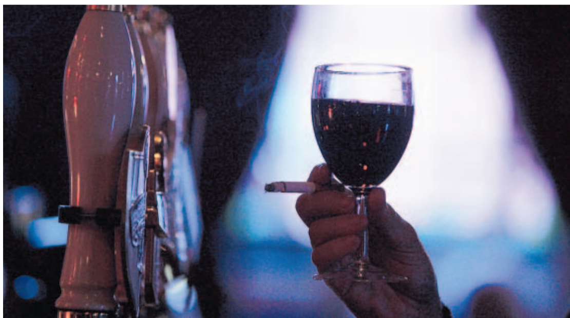
VICIOS. La comisión de garantes de reformas al sector salud busca generar mayor responsabilidad en el consumo de sustancias que ocasionan daños a la salud, como la bebida y el cigarrillo.

Después de cuatro días de rumba y volúmenes galácticos de licor, cigarrillos y comida chatarra, algunos podrían preguntarse qué efectos tendrá tanto desenfreno en la salud de los panameños y quién pagará la cuenta.