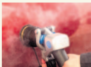
PASE A LA 41A