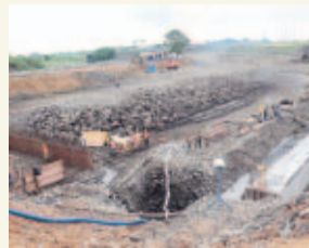
PASE A LA 40A