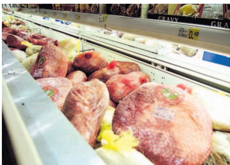
ABASTO. El contingente proveerá con tiempo el mercado doméstico de jamones y otros productos porcinos.