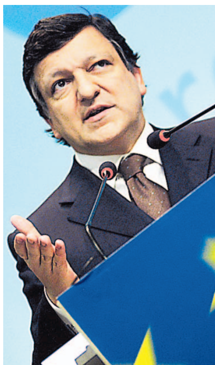
INTEGRACIÓN. José Manuel Barroso, presidente de la Comisión Europea, durante una conferencia de prensa en Bruselas.

El 24% o 572 millones de dólares del programa de ayuda de la Unión Europea se destinará a combatir la pobreza en Nicaragua y Honduras, países con las peores condiciones de pobreza en la región junto a