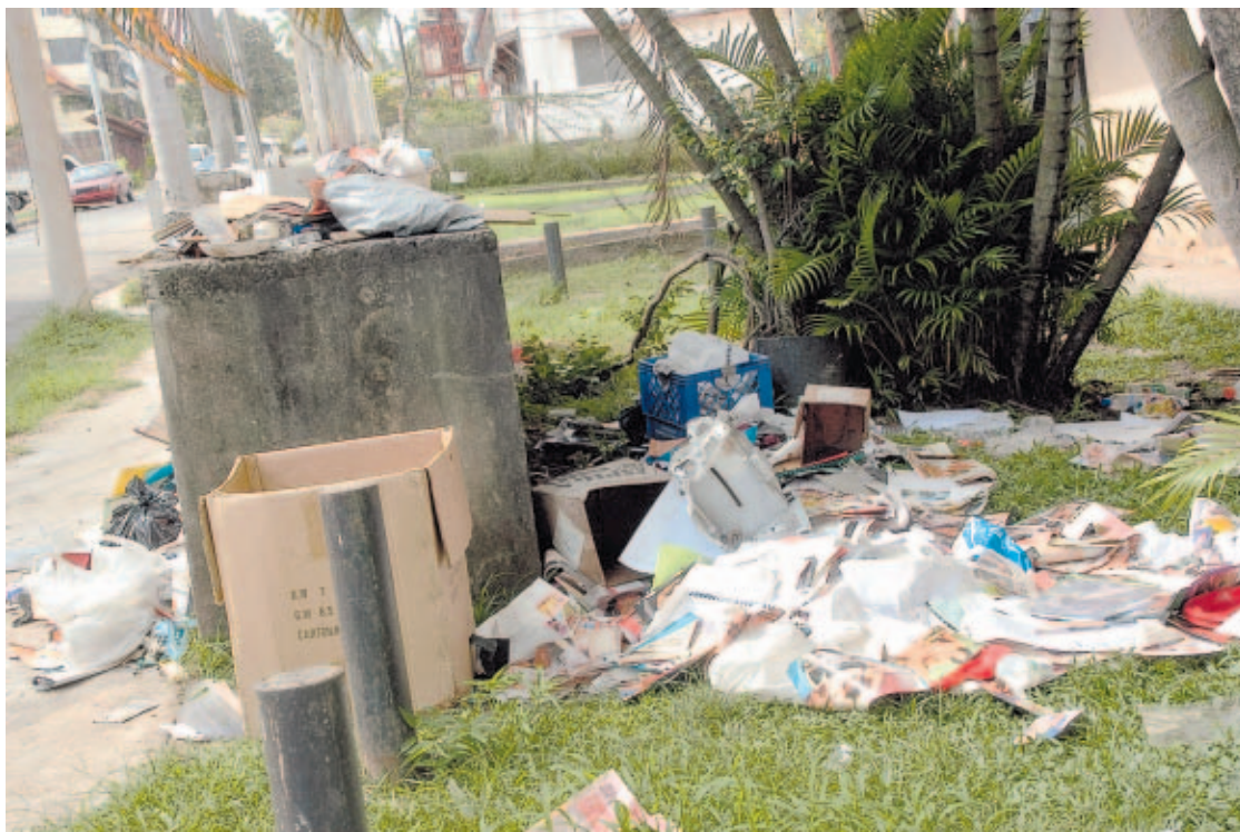
BELLA VISTA. Las autoridades señalan que en los últimos dos meses del año la generación de basura aumenta considerablemente.

Barriadas y áreas públicas están llenas de basura. La Dirección de Aseo tiene 35 vehículos para 112 rutas.