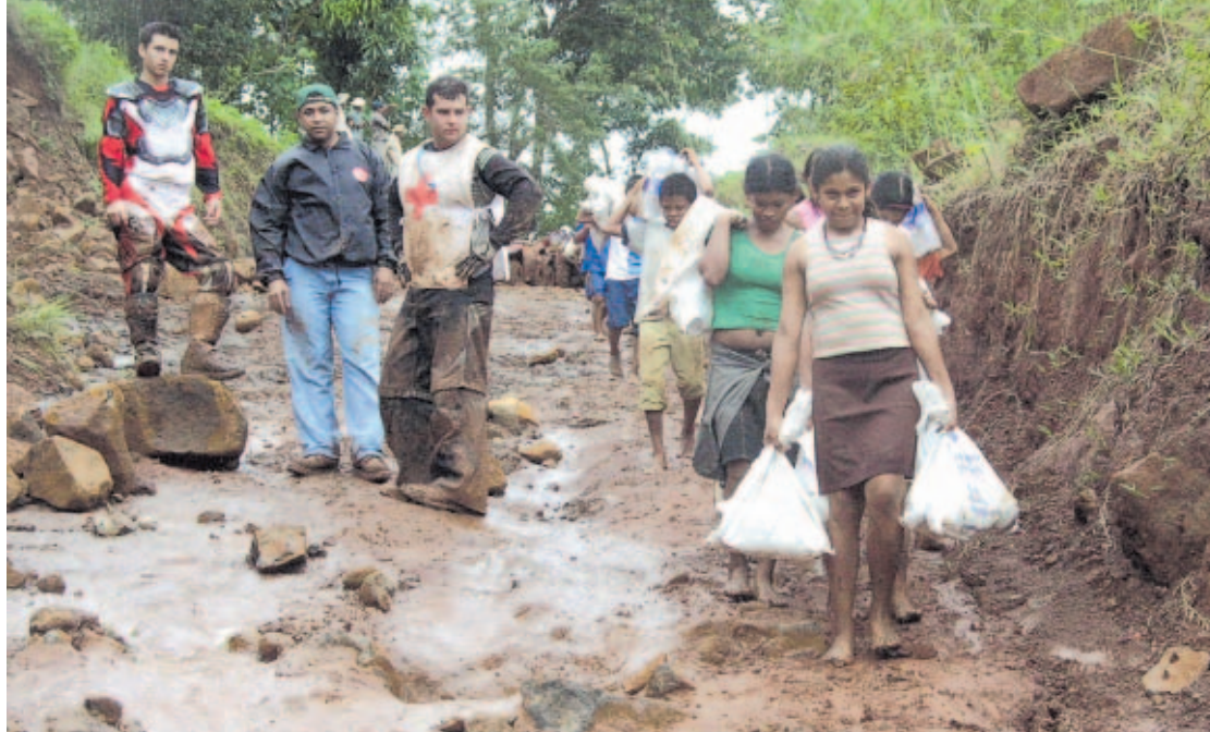
ASISTENCIA. Ayer se pudo extender más la ayuda a otros sectores.

"Ese día venía de trabajar todo el día con pico y pala tratando de limpiar la carretera que conduce a la comunidad