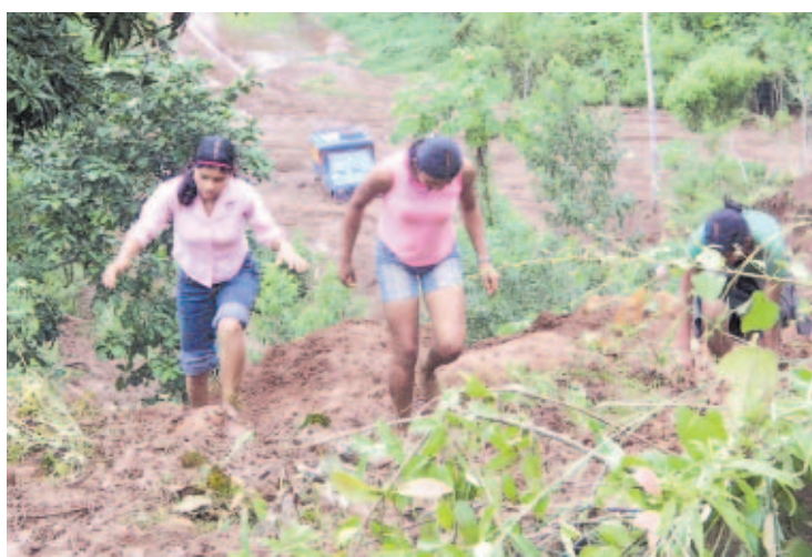
CATÁSTROFE. Los daños a los caminos impiden el paso de carros hacia las áreas afectadas.