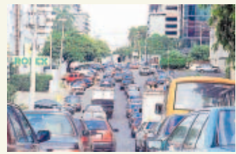
PASE A LA 31A