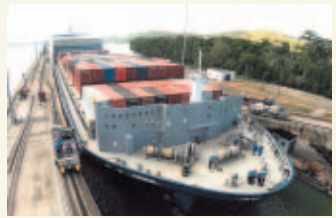
PASE A LA 30A