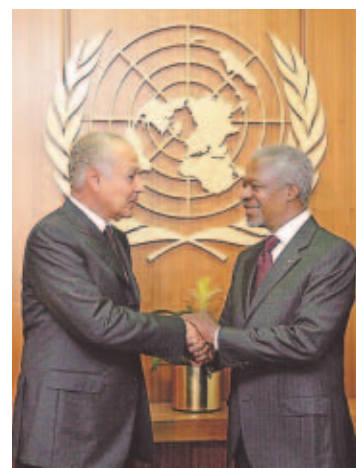
Kofi Annan dirigirá su última Asamblea.

el secretario general Kofi Annan instó a los líderes mundiales a responder a las críticas crecientes hacia la ONU, y a restaurar la credibilidad de la organización, al adoptar reformas amplias y necesarias para que el mundo actúe en forma coordinada con el objetivo de enfrentar la pobreza, el terrorismo y los conflictos armados.