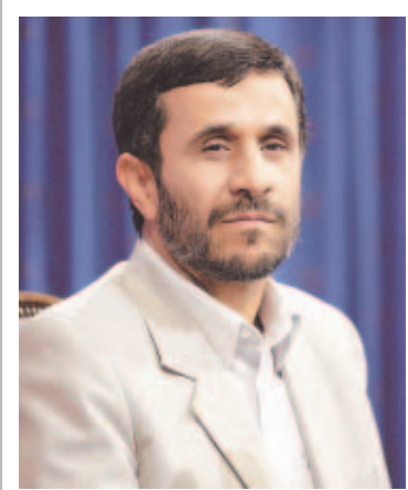
Mahmud Ahmadineyad