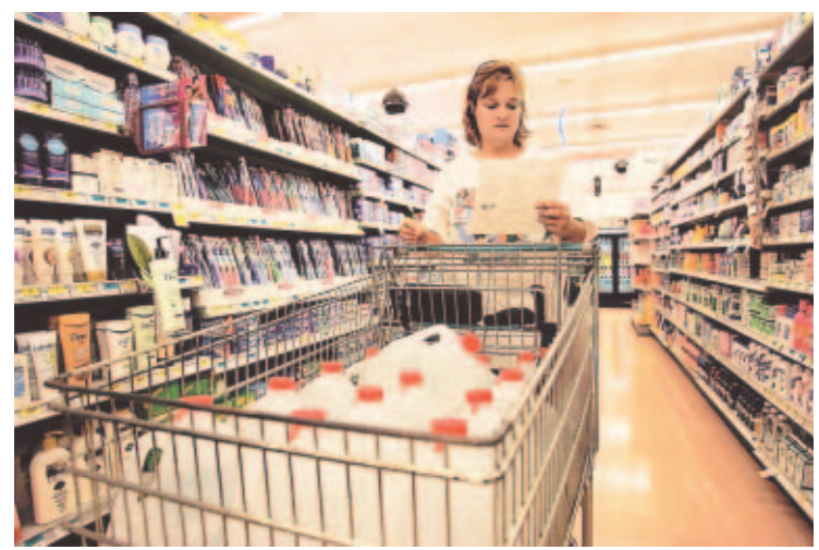
PREVENCIÓN. Las personas se abastecieron de víveres como medida de precaución.

La tormenta tropical "Ernesto" comenzaba a emparar en la tarde de ayer el estado de Florida con intensas lluvias que amenazaban con causar inundaciones. Ayer, el vórtice de "Ernesto" con vientos máximos sostenidos de 75 kilómetros se encontraba a 165 kilómetros al sur de Miami y se desplazaba a 20 kilómetros por hora. "Se está moviendo hacia el noroeste y en esa trayectoria el centro de "Ernesto" estará muy cerca de los cayos de Florida y el extremo sur del estado esta noche", informó