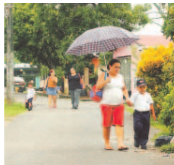
Calle Primera de Panamá Viejo.

teger el patrimonio y el desarrollo turístico, y estudian la manera de deshabilitar el tramo de la vía Cincuentenario que atraviesa actualmente el monumento histórico. La carretera podría ser reemplazada por una vía pública construida sobre rellenos, paralela al Corredor Sur.