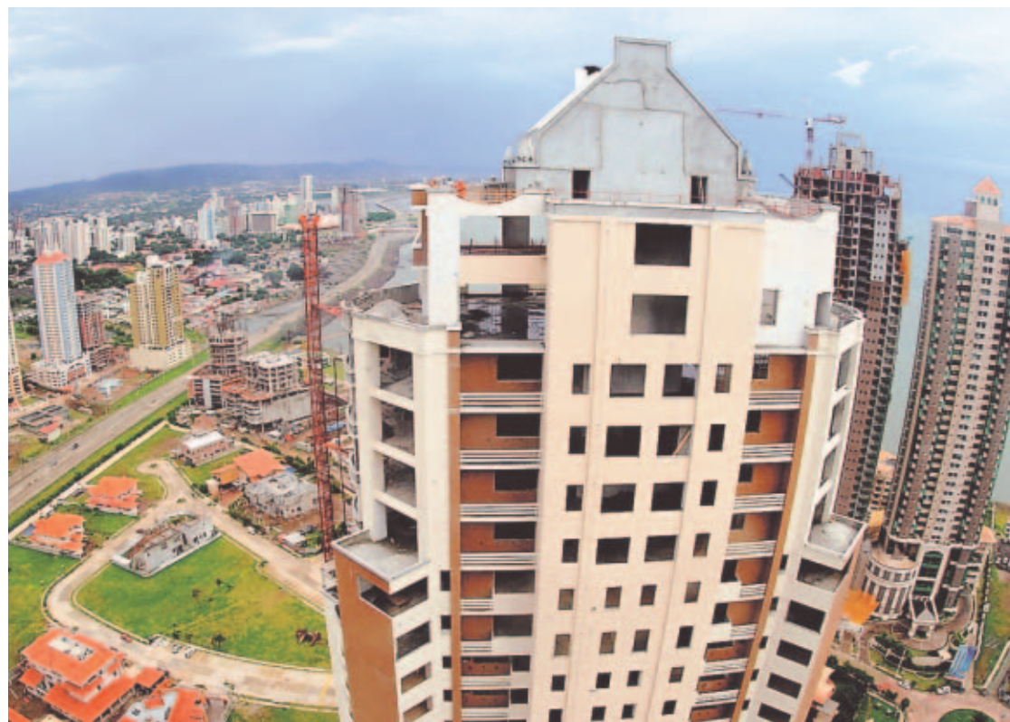
VENTA DE ILUSIONES. El ‘boom’ del sector inmobiliario es un fenómeno que se está experimentando en toda América Latina.

“No es una exageración decir que están comprando de media docena en adelante”, dijo