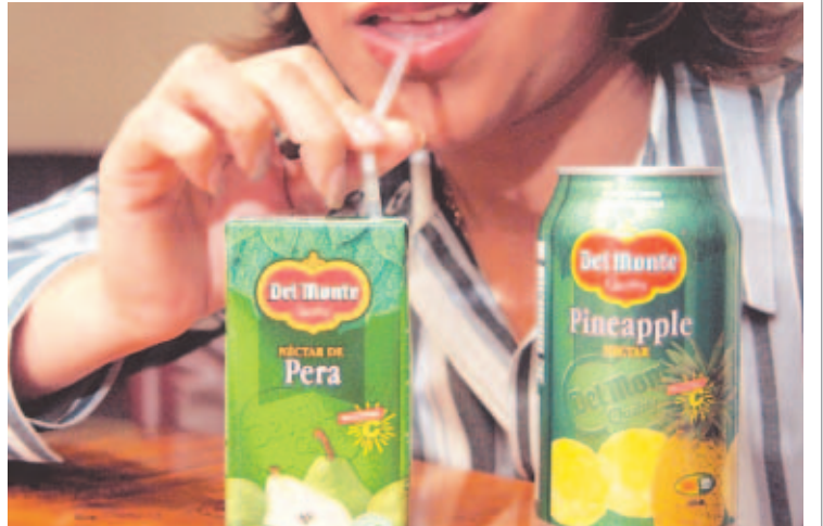
NÉCTAR. Del Monte Panamá cubre con sus jugos el mercado de Centroamérica y el Caribe.

Del Monte Panamá surge en 1996 cuando la familia Cana-