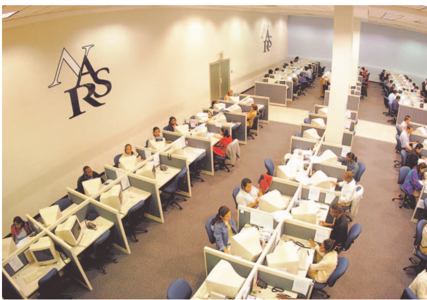
ATENCIÓN. Los colaboradores de los centros de llamadas que operan en el área metropolitana tienen edades comprendidas entre 18 y 29 años.