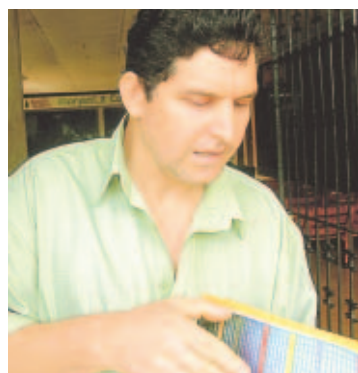
El padre no culpa a nadie.