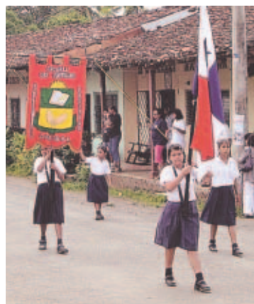
Estudiantes participaron en el desfile.

El distrito fue fundado en 1558 por Juan Ruiz de Monjaraz, y el fraile dominico Pedro de Santamaría. Parita